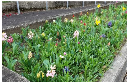
モデル事業実施花壇（令和4年3月中旬）