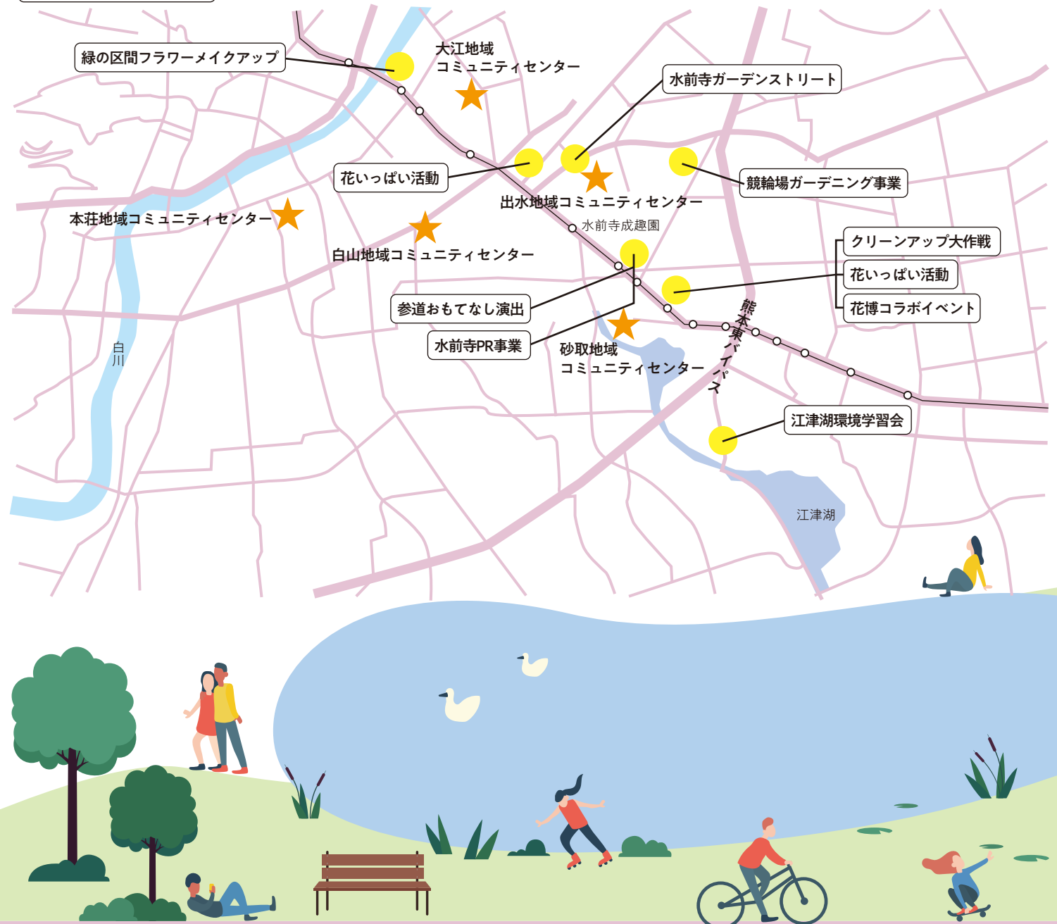
季節の花の種配布(5箇所★)

水の都とも言われる熊本市。その象徴となっているのが、約400年の歴史を誇る水前寺成趣園と、1日約40万トンの湧出量を誇る江津湖です。そんな市民憩いのスポットの美化活動はもちろん、この豊かな環境を未来へ繋げていくために、行政や自治会、学校だけでなく、さまざまな地域団体が、それぞれの個性や強みを活かした活動を続けています。